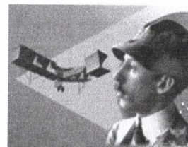
TERRA DE SANTOS DUMONT